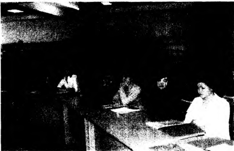
«Менің Отаным – Қазақстан!» оқырмандар конференциясына қатысушы ақын қыздарымыз.